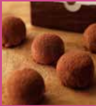
しょこもち 6個入 ¥980