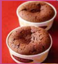
蒸し焼きショコラ 1個 ¥146 / 箱詰6個入 ¥950