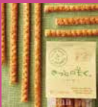
きっと咲く。 各¥420 / 3種セット ¥1,380