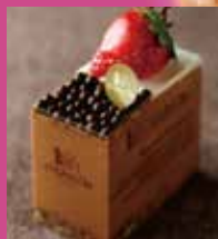
ショコラナンタン ¥388