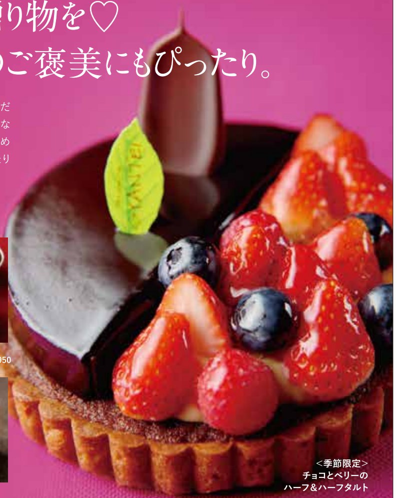
<季節限定> チョコとベリーの ハーフ&ハーフタルト