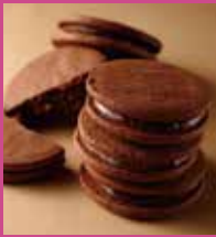
ショコラート 1個 ¥183 / 5個入 ¥1,080